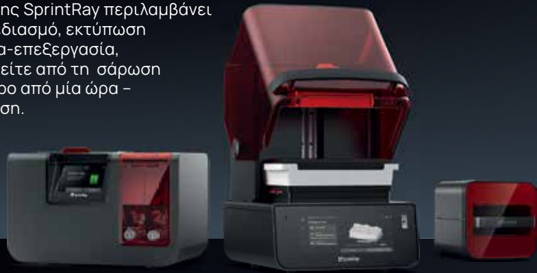
PRO WASH S

Το πλήρες οικοσύστημα της SprintRay περιλαμβάνει αυτοματοποιημένο AI σχεδιασμό, εκτύπωση ακριβείας και εύκολη μετα-επεξεργασία, κι έτσι μπορείτε να μεταβείτε από τη σάρωση στην εκτύπωση σε λιγότερο από μία ώρα – όλα με ελάχιστη εκπαίδευση.